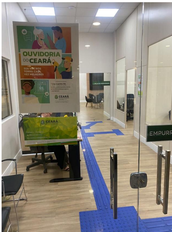
Entrada Secretaria de Proteção Animal:

A Ouvidoria Setorial da Secretaria de Proteção Animal do Estado do Ceará adotou práticas exemplares em termos de identificação visual e divulgação dos seus canais de participação, um esforço notável para uma entidade com apenas cinco meses de existência. Em um curto período desde sua criação pela Lei nº. 18.442, em 31 de julho de 2023, a Secretaria tomou medidas proativas para garantir que sua Ouvidoria fosse facilmente reconhecível e acessível ao público. A colocação estratégica de banners e cartazes na entrada principal da Secretaria, na entrada da sala de atendimento da Ouvidoria Setorial, e em áreas de alta circulação como a parte externa próxima à entrada e ao lado dos elevadores, demonstra um compromisso com a visibilidade e a acessibilidade do serviço.